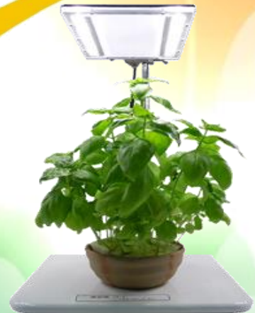
癒し系(焼物シリーズ)