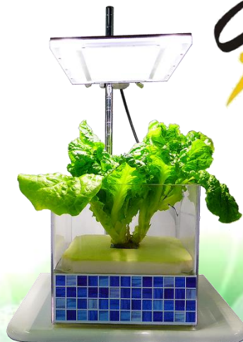
ミニ水耕栽培(オプション販売)