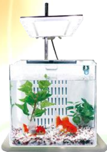
アクアリウム系(アイデア品)