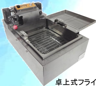
卓上式フライヤー

●この温調ユニットは、厨房機器メーカーの OEMで開発から製造までを行っています。